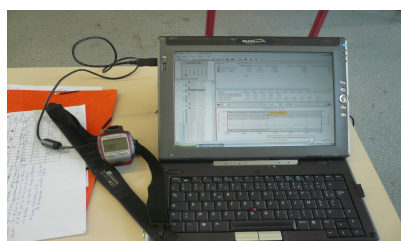
Dispositif pour visualiser les courbes

C'est le niveau de compétence acquis qui est ainsi évalué et non pas un niveau de performance en km/h